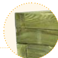
➤ Assemblage croisé