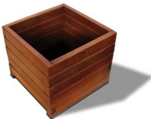
➤ Assemblage croisé