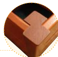
➤ Angles d'assemblage bois massif monobloc