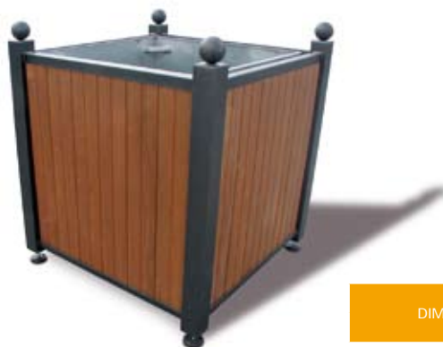
➤ Finition boule