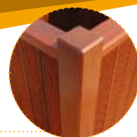
➤ Finition soignée